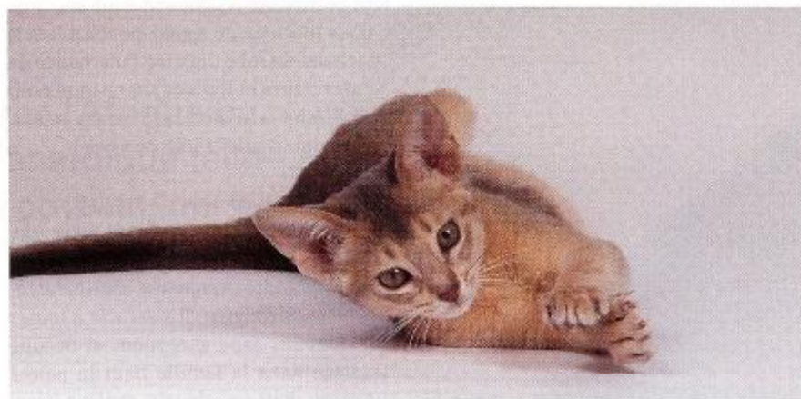
Pour ce petit lionceau qui ne ratera jamais une occasion de faire le clown, un territoire assez vaste sera nécessaire, que vous viviez en maison ou en appartement.

► pied par une zone piétonne du vieux Nice. Eden est très professionnelle malgré son jeune âge. Elle aime voir les transporteurs, rencontrer des gens, s'occuper de la manutention et notamment de l'imprimante, est attentive aux appels téléphoniques, et pratique le suivi des clients ! Nos deux vedettes connaissent la boulangerie... et le chat de la boulangère ! Elles sont si connues qu'il nous arrive d'entendre "Où sont les chats du vieux Nice ?", si pour une fois nous ne les emmenons pas ! »